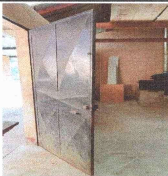
Foto 5: Se observa la puerta de acceso desajustada del modulo 3 (cocina) y existen algunos vidrios quebrados por reemplazar.