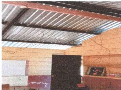
Foto 1: Se observa el deterioro de los cables del sistema eléctrico en el módulo 1, 2 y 3.