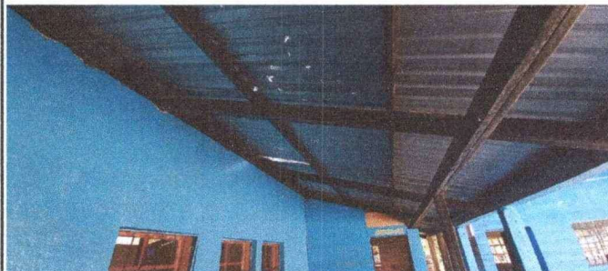
Foto 2: Se observan agujeros en la cubierta de lámina en el modulo 2.