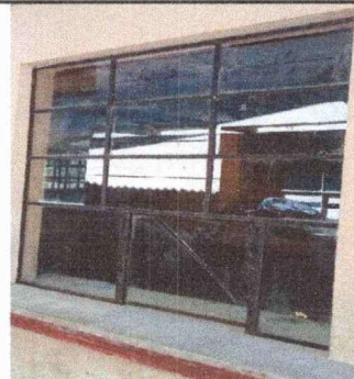
Foto 6: Se observan algunos vidrios quebrados por reemplazar del modulo 3.

Observación: Si es necesario se pueden agregar hojas adicionales y actualizar el número de hojas.